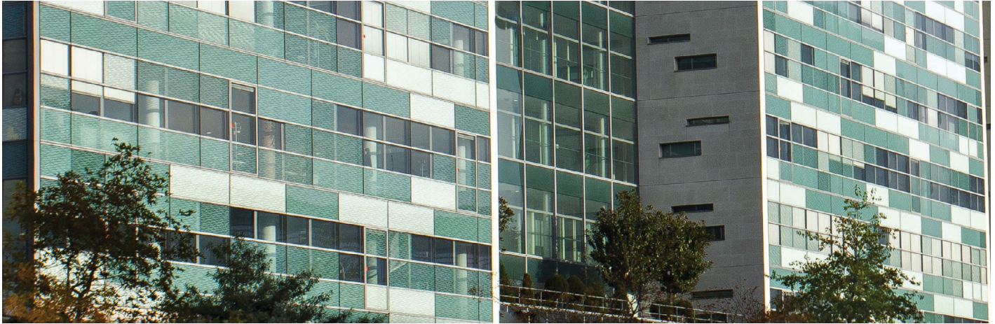
313, Terrasse de l'Arche - 92 Nanterre - Axe 13